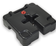
Base de Carpa