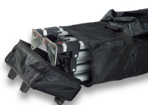
Estuche para Carpa